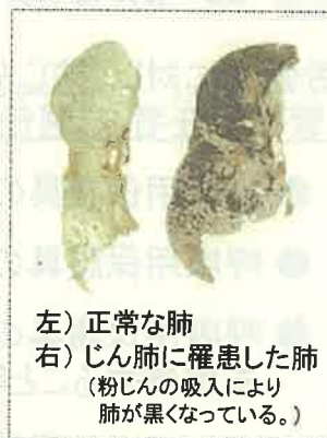
左) 正常な肺 右) じん肺に罹患した肺 (粉じんの吸入により肺が黒くなっている。)

現在、じん肺を治す根本的な治療がないため、じん肺にかからないための措置として、粉じんの発生源対策、局所排気装置等の適正な稼働、呼吸用保護具の適正な着用などにより、粉じんへの「ばく露防止対策」を徹底することが重要です。